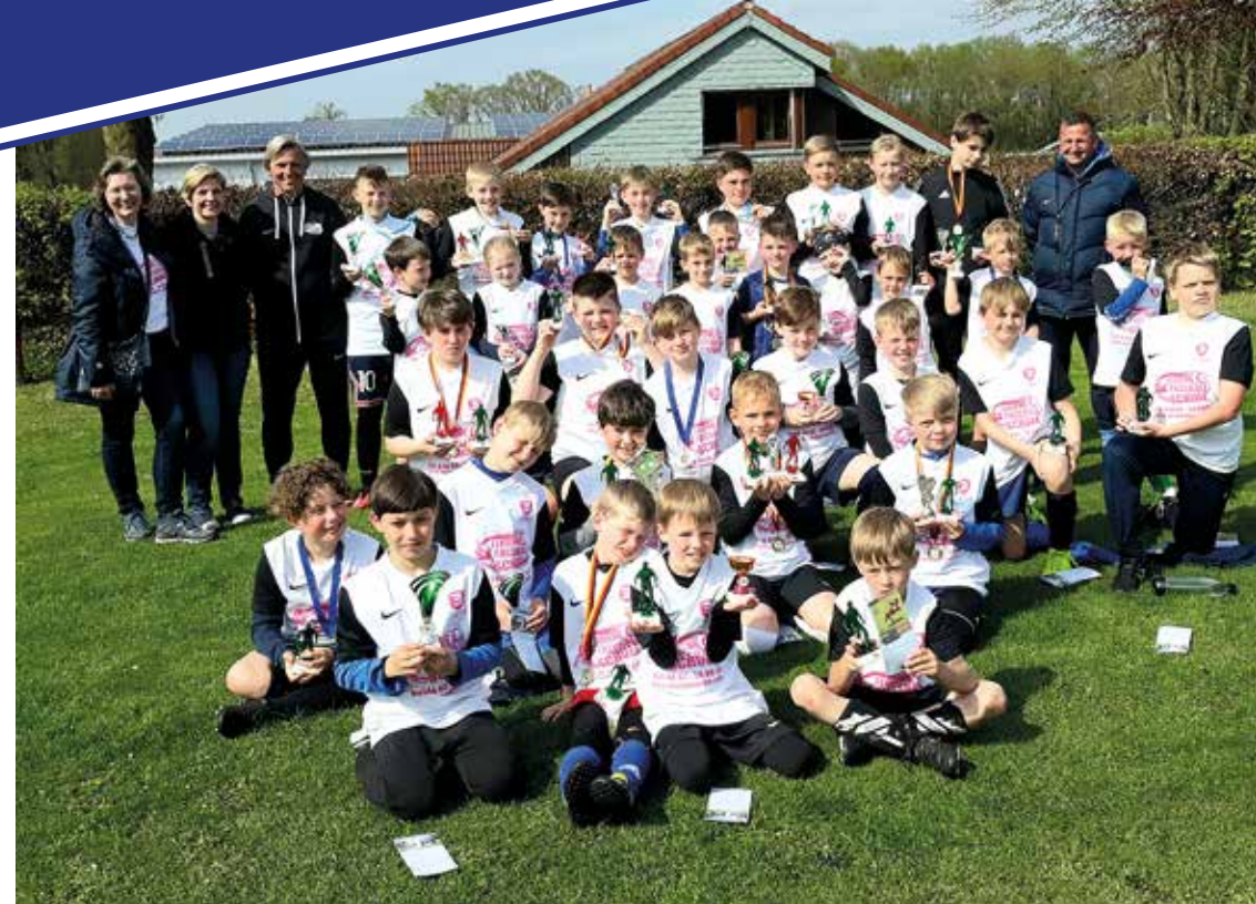
Ferienfußballschule zu Besuch bei der SG DHI in Groß Ippener.