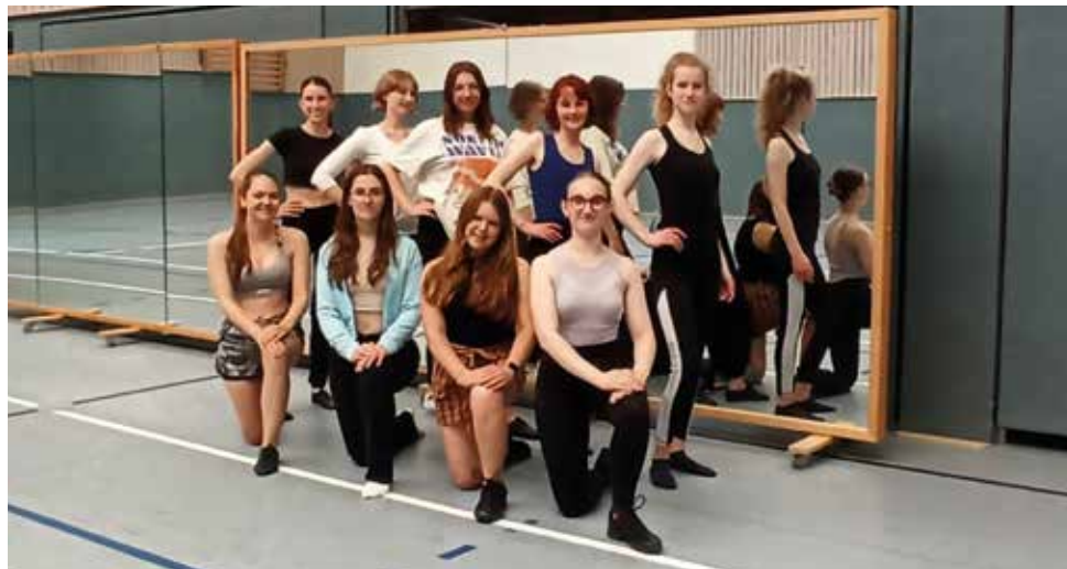
Dance-Gruppe ab 16 Jahre.