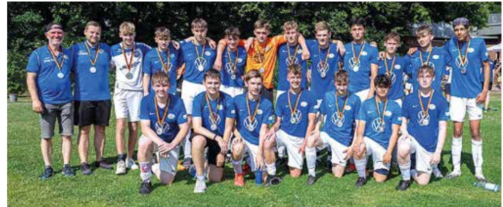
Silbermedaille im Kreispokal für die B-Jugend.