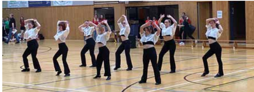
Der erste Auftritt der Dance-Gruppe bei der Korbball Landesmeisterschaft in Harpstedt.