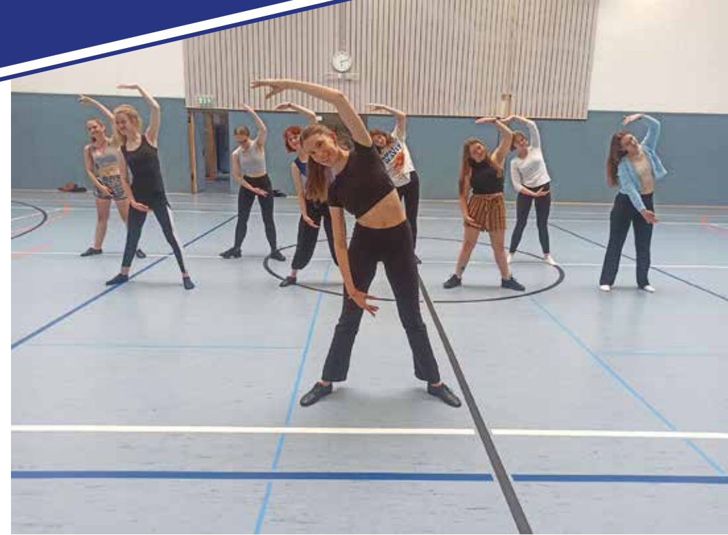
Aufwärmen bevor es mit dem Tanzen los geht.