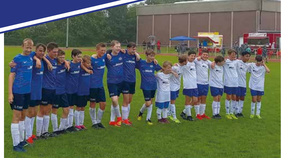
Saisonabschlussturnier der C2 beim FSV Jever mit Elfmeterschießen.

Bei dieser Gelegenheit möchten wir uns ganz herzlich bei „Allen“ (Eltern, Großeltern, Fans, Sponsoren und nicht zu vergessen bei unseren ehrenamtlichen Trainern und Betreuern) bedanken. Schön, dass es euch gibt.